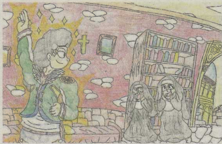
Imagen de uno de los capítulos del libro de Pedro Saputo. P.I.A

El objetivo del proyecto es acercar la cultura, las tradiciones y la historia de Aragón a las per-