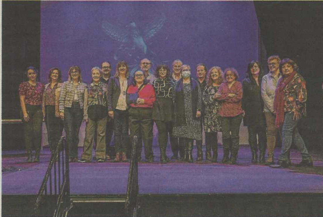
Las protagonistas del corto 'Voces' recogieron el galardón en el festival Be Free.

Ella fue víctima de violencia física y sexual, y también económica y psicológica, y la sufrió de manos de una persona muy próxima a ella. Bloqueada por la situación, en un primer momento Vanesa no se lo contó a nadie, pero luego lo