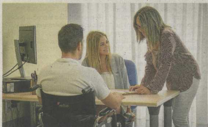
Asesoría especializada para los usuarios.

A lo largo del año 2022, los equipos jurídico y médico de Fundación Dfa atendieron a 231 personas a través del proyecto 'Fundación Dfa Contigo', cuyo objetivo es dar respuesta y facilitar información y orientación a las consultas específicas de las personas con discapacidad de Zaragoza a